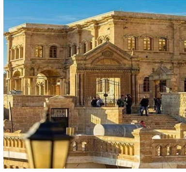
Altunboğa Medresisinde, Alınan Mühteşem Kapı

Muzafferiye Medresesi, Osmanlı döneminde, yenilenmesi yerine, Altunboğa Medresesi enkazından da taşlar alınarak ve medresenin mevcut taşlarını kullanarak, Rüşdiye Mektebini halkın, katkıları ile yapması bir Artuklu eserinin talan edilmesinin başka bir örneğidir. Aşağıdaki resim Altunboğa Medresesi kapısı bu okula tışınmıştır.