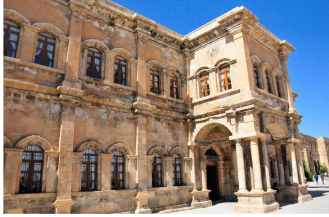
Muzafferiye Medresesi yerine inşa edilen Mekteb-i Rüşdiye

Medresenin Mimari ve Süsleme Özellikleri: Max Van Berchem'e ait bir fotoğrafta Muzafferiye Medresesi açıkça görülmektedir. Fotoğrafa göre doğu-batı yönünde uzanan dikdörtgen bir forma sahip olduğu anlaşılmaktadır. Konumu itibariyle de kuzey-güney yönünde eğimli bir araziye inşa edildiği güneydeki payandalardan anlaşılmaktadır. Medrese beden duvarlarının oldukça yüksek olduğu görülmektedir. Kesme taş malzemeden inşa edilmiştir (Bayezit, 2009, C. II, Pl. 96-97) (Foto 22- 23). Güney cephesinde belli aralıklarla sıralanmış üç adet payanda görülmektedir. Ortadaki payanda diğerlerine göre daha büyük olduğu anlaşılmaktadır. Yandaki payandalar yarım konik külah ile ortadaki payanda ise bir yarım kubbe ile örtülü olduğu görülmektedir.