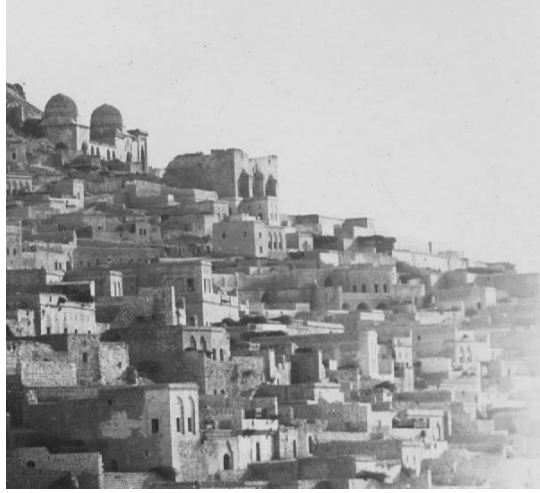
Muzafferiye Medresesi (D. Bayezit'ten) Rüşiye önceki başka bir resim